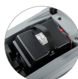
Kit Hybrid (pour version Hybrid)