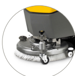
Petite roue externe pour régler la hauteur de la tête