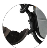
Soulèvement du système d'essuyage à pédale