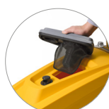
Couvercle amovible + flotteur + filtre