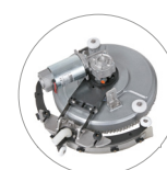
Système d'essuyage et rotation (jusqu'à 270°)